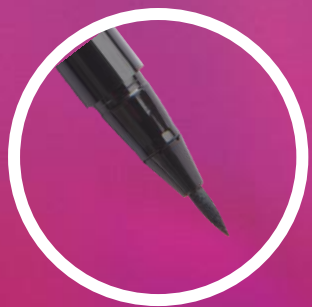
Punta tipo plumón