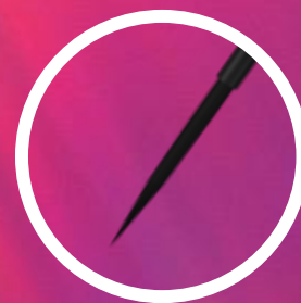
Punta tipo pincel